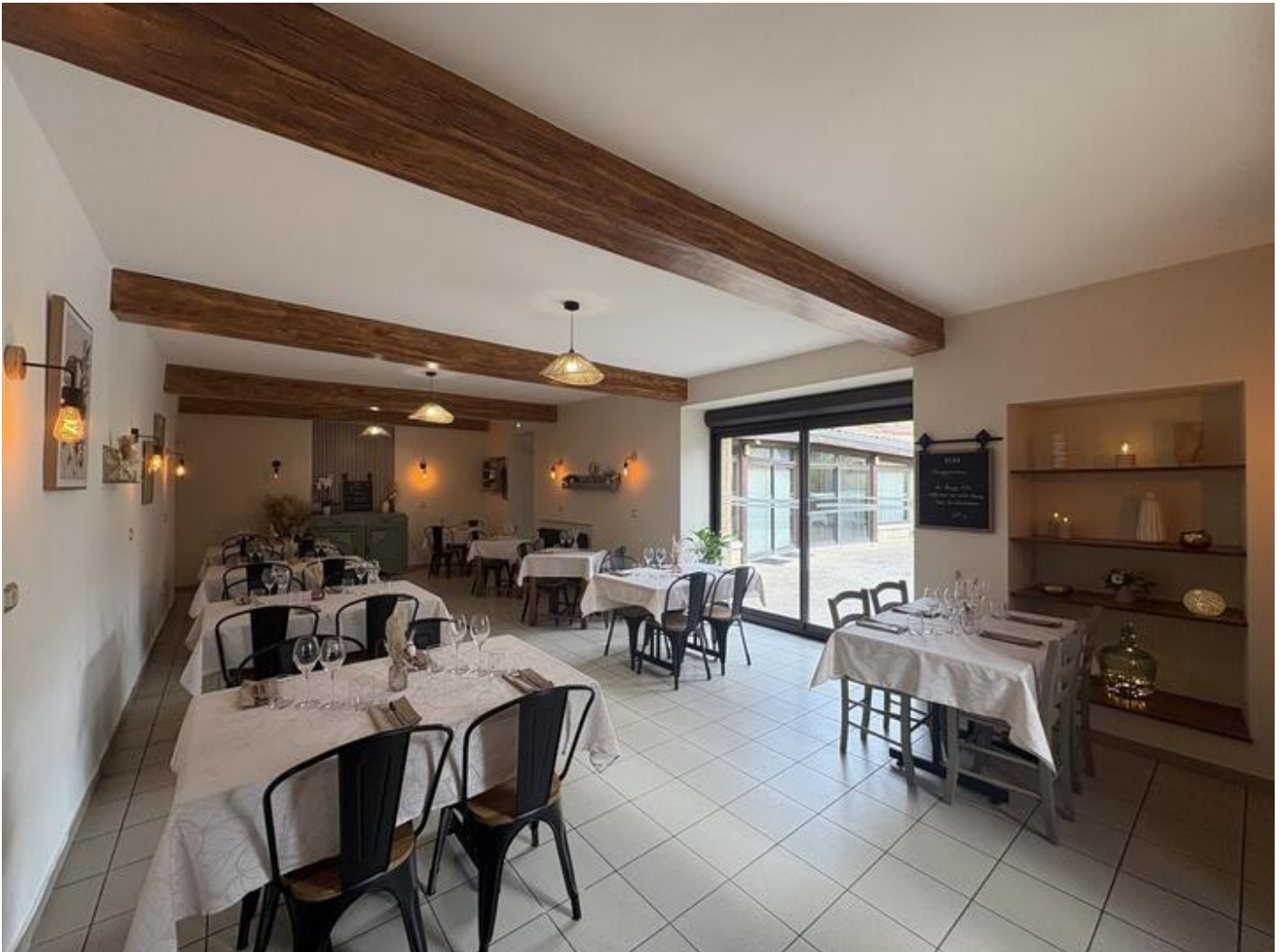
Au 12 saveurs 38160 Murinais

Situé au cœur du paisible village de Murinais, le restaurant Au 12 Saveurs a récemment rouvert ses portes sous la direction d'une nouvelle équipe, déterminée à faire de cette adresse une étape gourmande incontournable pour les visiteurs du territoire.