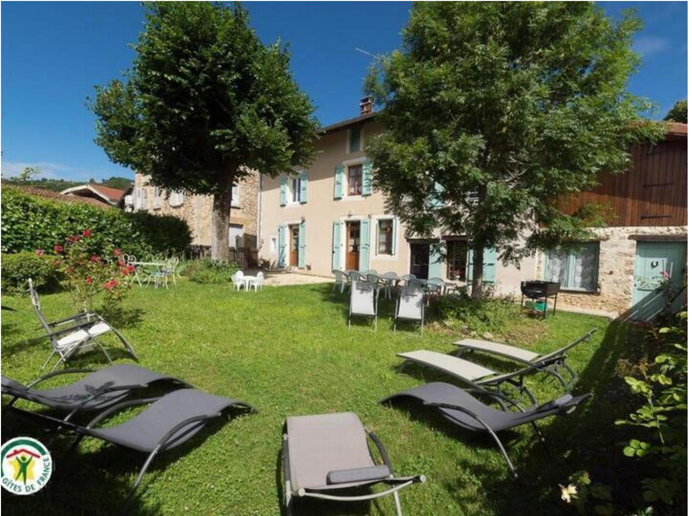
L'ombre du tilleul